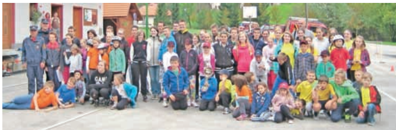
Skupinska fotografija udeležencev tekmovanja v rolanju za gasilsko mladino

Tekmovalci, ki so osvojili prva tri mesta v posamezni kategoriji, so prejeli medalje. Za najuspešnejše društvo pa je pokal prejelo PGD Tunjice. Da je bilo tekmovanje kar se da pravično, so poskrbeli sodniki, pri organizaciji pa so pomagali člani PGD Špitalič. Z gasilskim pozdravom Na pomoč!