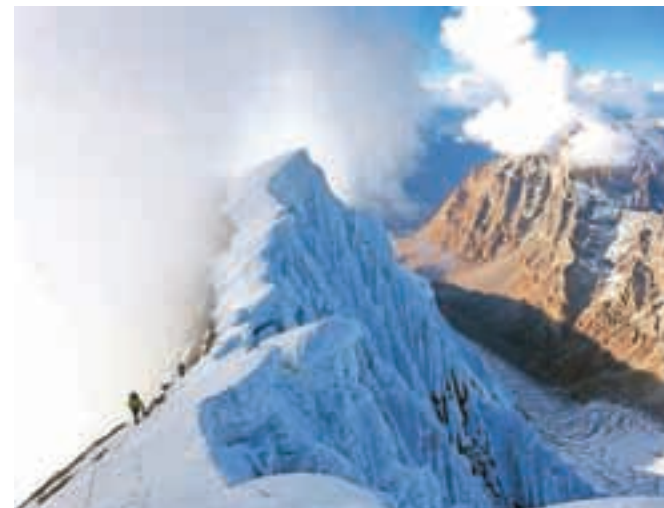
Zahtevno grebensko prečenje s severnega proti glavnemu vrhu Hagšuja

v alpinizmu v letošnjem letu, pa jim je vsekakor zelo blizu. Vsi trije vzponi pa sledijo modernim tokovom v alpinizmu – vzponi po najtežjih smereh (po možnosti prvenstvenih) v šest- ali sedemdesetih letih.