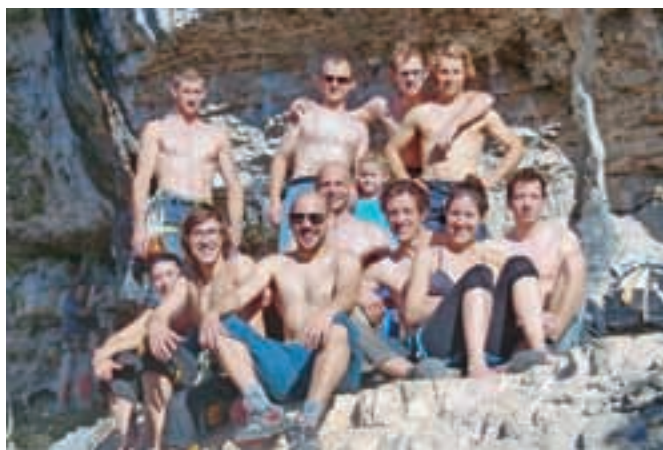
Vsi smo bili mnenja, da se bomo v Ceredo še vrnili.

Plezališče je od vasi oddaljeno okoli 5 km, dostopa do stene je dobrih 5 minut, smeri pa je okrog 150. Plezališče je kar staro, zato so predvsem lažje smeri zlizane. Prevladuje plezanje v