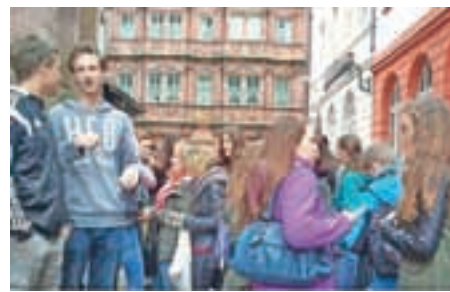
Schöne Grüsse aus Neustadt

Pred in po počitnicah se je pri nas veliko odvijalo v nemščini – drugi letniki gimnazije so se mudili na izmenjavi v nemškem Neustadtu. V simpatičnem mestecu so spoznali gimnazijo, si ogledali podjetje – BASF in tovarno pločevink ter znamenito vinsko hišo. Obiskali so tudi Mannheim in univerzitetni Heidelberg.