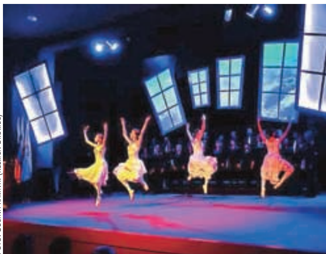
Slovesnost v Domu kulture Kamnik je spremljal tudi odličen kulturni program kamniških izvajalcev.

lahko ponosni na to, da smo v mnogih prelomnih trenutkih naše zgodovine imeli žene in može, ki so domoljubno, modro, pogumno in odločno sledili svoji viziji. Današnja slovesnost je do-