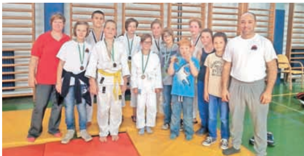
Kamniški judoisti so na tekmovanju v Ljubljani osvojili šest medalj.