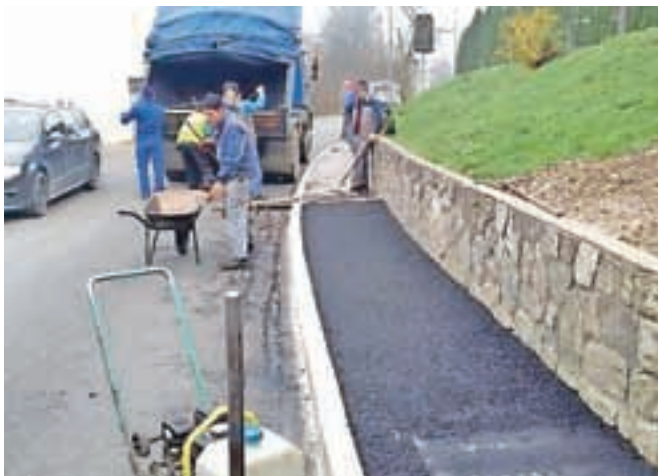
Asfaltiranje pločnika na Tunjiški cesti

tem odseku zgradili meteorološko kanalizacijo s cestnimi požiralniki, kabelsko kanalizacijo za javno razsvetlavo in robnike za pločnike. Na občini opozarjajo, da je Tunjiška cesta zaradi del zaprta za ves promet, v času zapore pa je urejen obvoz preko Koših v smeri Kamnika in preko Stolnika v smeri Tunjic. »Občane in občane ter stanovalce znotraj zapore prosimo, da upoštevate prometno signalizacijo. Ker se dela izvajajo tudi ob sobotah med 7. in 13. uro, vas