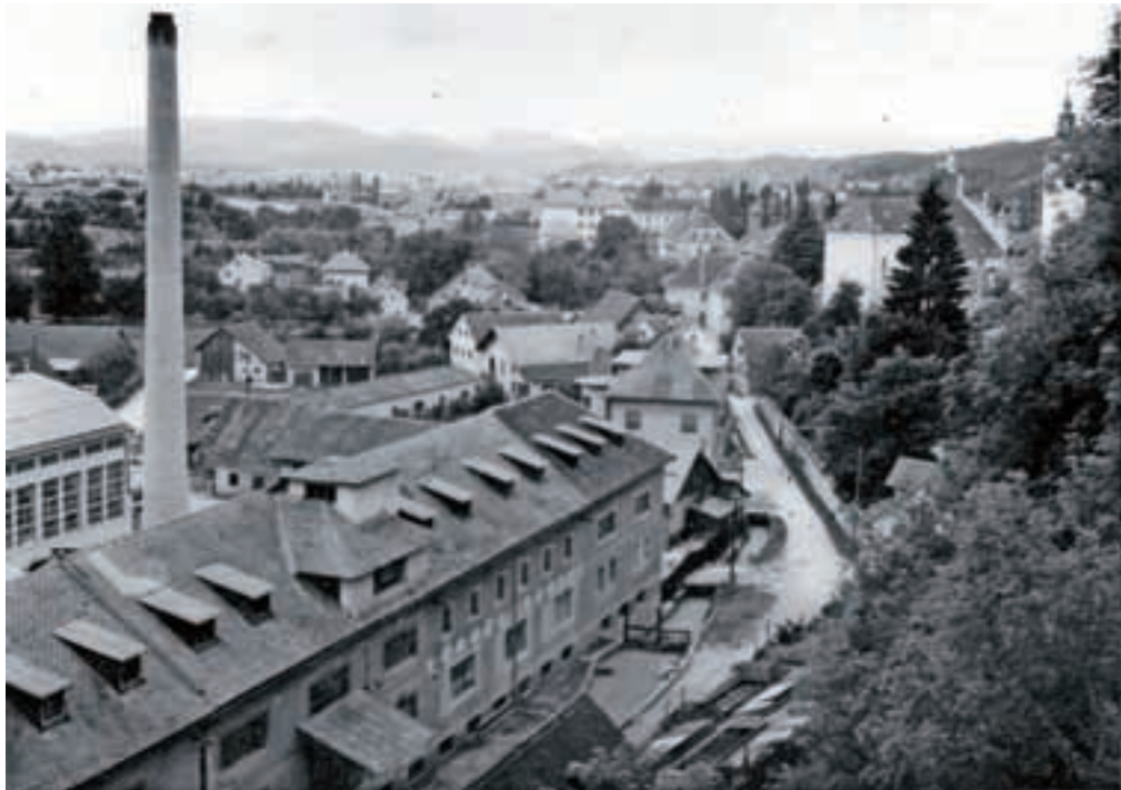
Mogočni Utokov dimnik je padel marca leta 1998 nekaj minut čez poldne.

V Medobčinskem muzeju Kamnik na gradu Zaprice so odprli razstavo o sedmih (nekdanj) najuspešnejših kamniških tovarnah, ki imajo korenine na koncu devetnajstega ali na začetku dvajsetega stoletja: Titanu, Svilanitu, Kiku, Eti, Svitu, Utoku in Stolu. Že na odprtju se je obiskovalcev, ki so si z nostalgijo in ponosom ogledovali izdelke kamniških tovarn, kar trlo.