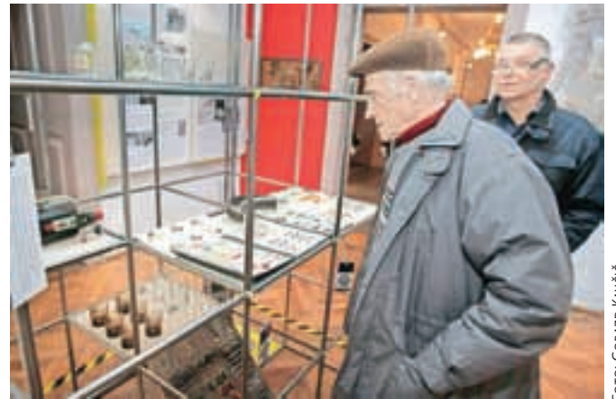
Razstava zgodbe kamniških tovarn sporoča preko predmetov, dokumentov, fotografij in kratkih filmov.