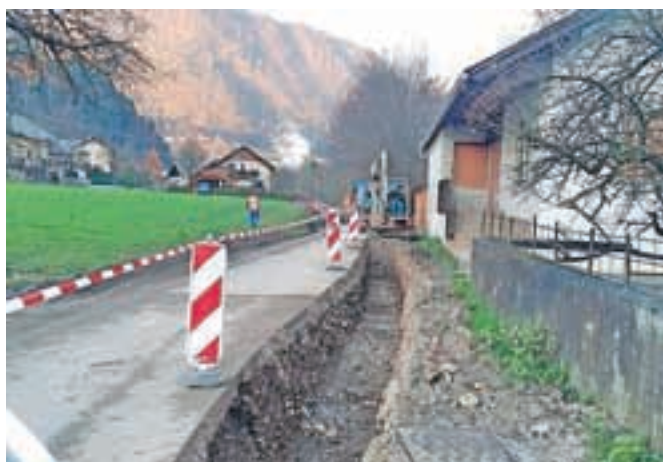
Gradbena dela v Zagorici nad Kamnikom

O zaporah javnih površin zaradi gradnje kanalizacijske in vodovodne infrastrukture Občina Kamnik občane redno obvešča na svoji spletni strani www.kamnik.si .