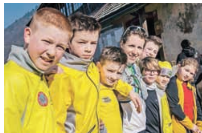
Organizacijo letošnje zimske lige prevzema Klub gorskih tekačev Papež.

Kamnik – Jutri, 29. novembra, se bo začela že 6. zimska liga na Sv. Primoža, ki sta jo pred leti vpeljala Tomaž Cukjati in Sandra Prešern, letos pa jo je pod svoje okrilje prevzel Klub gorskih tekačev Papež. Liga bo trajala vse do 7. marca, petnajst zaporednih sobot, vsakič s startom ob 9. uri izpred Lovskega doma na Vegradu. Do Sv. Primoža se teče ali hodi po cesti naokoli, brez bližnjic, organizatorji pa stavijo na »fair play«, saj si bo vsak udeleženeč čas meril sam. Vpisna knjiga v okrepčevalnici Pri Petru, kamor bo vsak lahko zapisal svoj čas, bo odprta ob sobotah med 9. in 10.30. Za končni rezultat bo štel povprečje desetih najboljših vzponov. J. P.