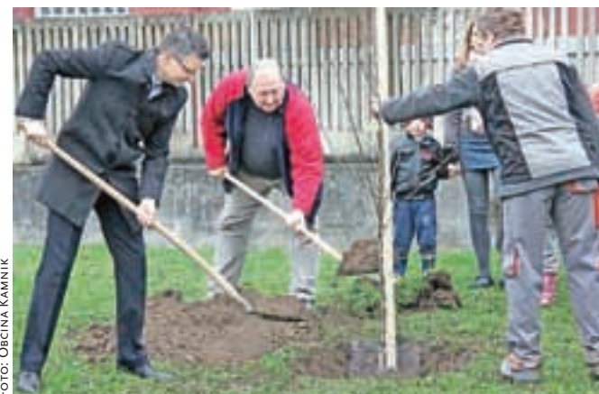
Na vrtu za enoto Pestrna je župan takole posadil jablano.