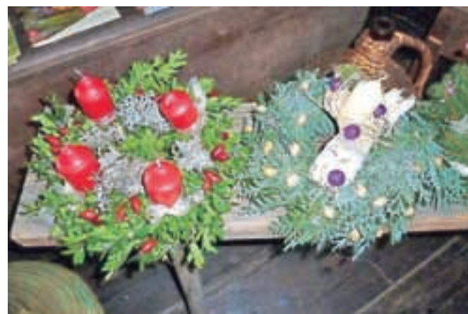
Konec novembra je bil v Budnarjevi hiši tudi letos namenjen izdelovanju adventnih venčkov.

va je tudi smernica gotike, ki prisega na manj barv, črno, kontrastno ter preproste motive, zadnja smernica pa je namenjena bolj romantičnim dušam, saj narekuje bolj pastelne barve.« V Budnarjevi hiši so se usmerili predvsem v narav-