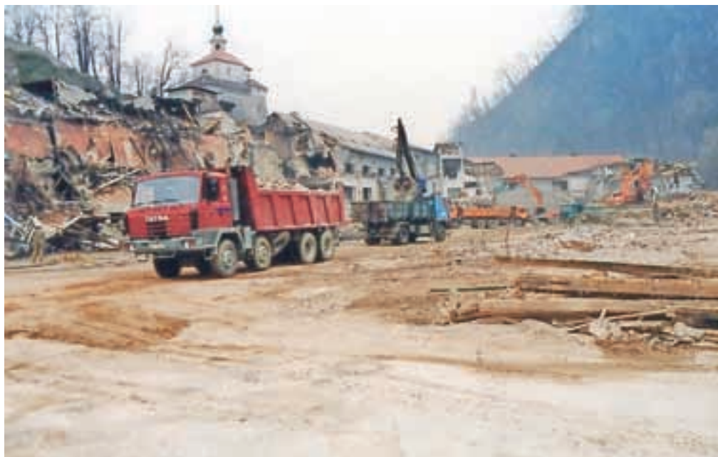
Takole se je leta 1988 končala Utokova zgodba.

Eta še relativno dobro dela, a je treba vedeti, da je danes zaposlenih zgolj desetina iz tiste kvote, ki je delala na vrhuncu tovarne. Titan še dela ključavnice, a ga je