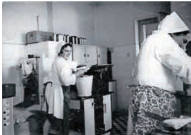
V tovarniških menzah so lepo skrbeli za polne želodce zaposlenih. Tale fotografija je bila posneta v Utoku.