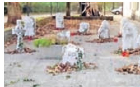
Se mračne sile so pred Dom kulture naselile ...

A če si takega opazovanja v prihodnosti želite lotiti sami, pozor: Nikoli ne opazujte Sonca s kakršnimkoli daljnogledom, teleskopom ali podobno optično napravo brez uporabe posebnih filtrov; posledica bi bila trajna oslepitev! Nebesne skrivnosti pa so zakrile tudi grooooozen in strašljiv uvod v noč čarovnic. Obiskovalci muzikala Immortals so uvod v predstavo doživeli že pred Domom kulture, do svojega mesta so se namreč morali prebijati skozi mesto mračnih sil.