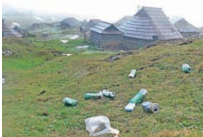
Tako se ne dela.

Velika planina se pripravlja na zimo, na sneg, ki bo prekril vse njene planjave in širjave, od divjih prašičev in traktorjev razrito zemljo in tudi drugo nečednost. Morda so ravno to, da bo sneg Planini prinesel belo deviškost, imeli v mislih tisti, ki so si na klopki nad Gradiškovo bajto privoščili privezovanje duše s sendviči, pivom in cigaretami, a vso embalažo in čike nato pustili nastlane okrog. Tako se ne dela. Če so lahko polno pločevinko piva prinesli gor, bi lahko prazno tudi dali v nahrbtnik in odnesli dol. Če so plastično vrečko s sendvičem prinesli lahko gor, bi lahko tudi samo vrečko odnesli dol. V šestdesetih letih kar hodim na Planino, še nisem videl tako velikega onesnaževanja od »turistov«. Tudi takrat ne, ko je bilo na njej v enem dnevu okoli 6000 obiskovalcev. Bojan Pollak