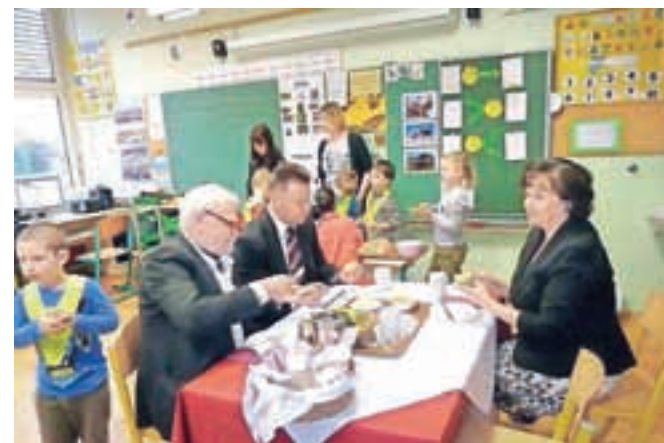
Na Osnovni šoli Frana Albrehta v Kamniku so ob tradicionalnem slovenskem zajtrku gostili ministrico za kulturo mag. Julijano Bizjak Mlakar.

cem več razredov – s prvošolci sta si privoščila tradicionalni slovenski zajtrk (kruh, maslo, med, mleko in jabolko), petošolcem sta prisluhnila pri pogovoru o pomenu lokalno pridelane hrane, devetošolci so z njima delili del šolske ure o zajtrku in bontonu po svetu, ob koncu pa sta obiskala še razred sedmošolcev, ki so dan slovenske hrane povežali s slikanjem panjskih končnic.