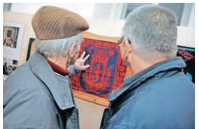
Najbolj prepoznaven izdelek Svilanita so (poleg kravat) še danes brisače.