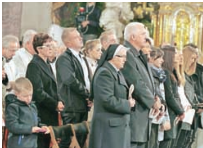
Slovesnosti so se udeležili tudi Zoretovi najbližji.

učil spoštovati človeka in stvarstvo. Spomnil se je brata in sestre. »Učili smo se živeti drug za drugega. Učili smo se v resnici biti bratje in sestre,« je povedal v zahvalni besedi. Zahvalil se je predstavnikom slovenskega političnega, gospodarskega, kulturnega in znanstvenega sveta, bratom duhovnikom, redovnikom in redovnicam. Nagovor je sklenil z besedami: »Vsem vam, pomembnim in preprostim, učenim in neukim, zdravim in bolnim, starim in mladim, svetim in grešnim, vsem kličem, veselite se v Gospodu. In vašega veselja Vam ne bo nihče vzela. Mir in dobro, bratje in sestre!«