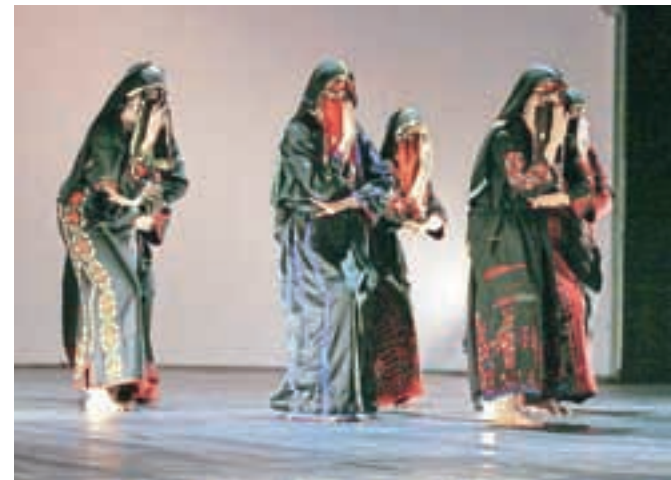
Ples dahiye v tradicionalnih oblačilih Beduinov Sinaja