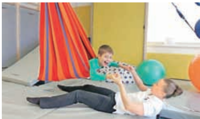
Senzorna soba je igralnica za otroke s senzomotoričnimi okvarami.

nih sob pri nas, namenjene igri otrok, ki imajo senzomotorične okvare. Ureditev prostora in nakup potrebne opreme je znašal dobrih 32 tisoč evrov, sedemnajst tisočakov so prispevali donatorji, 500 evrov Občina Kamnik, preostanek pa je zagotovil zavod sam, od tega so večji del denarja zbrali na februar-skem dobrodelnem koncertu v ta namen Skupaj do novega cilja.