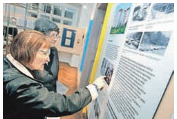
Iskanje znanih obrazov na razstavnih panojih