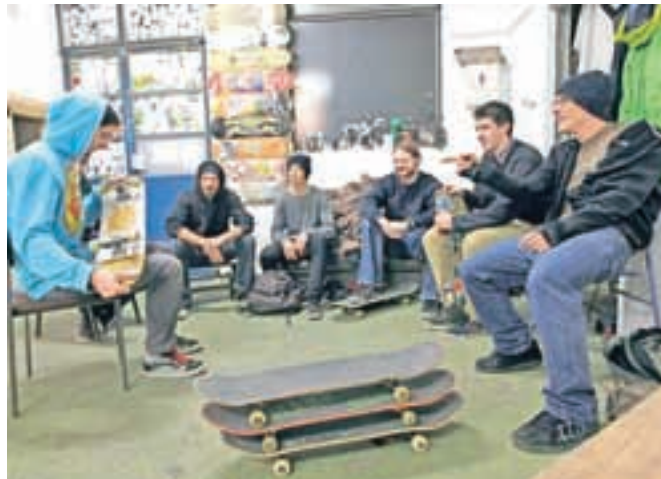
Del članov ŠD Debela Veronika v skejterskem parku, ki so ga uredili v prostorih nekdanjega Alprema.

Kot poudarjajo, je namenjen prav vsem (rolkarjem in rolarjem), uporaba je brezplačna, možna je tudi izposoja opreme, ker pa za-