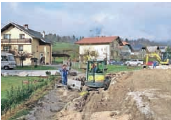
Dela se nadaljujejo tudi v Zgornjih Stranjah.