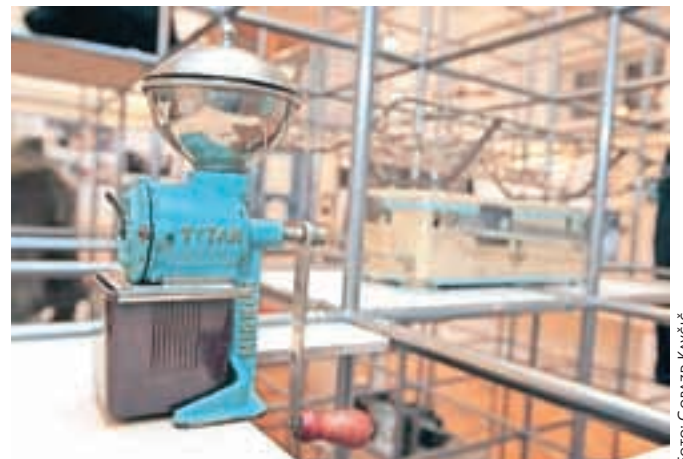
Na razstavi so na ogled številni izdelki, ki so nekdanj ime Kamnika popeljali daleč naokoli. Tudi Titanovi mlinčki.