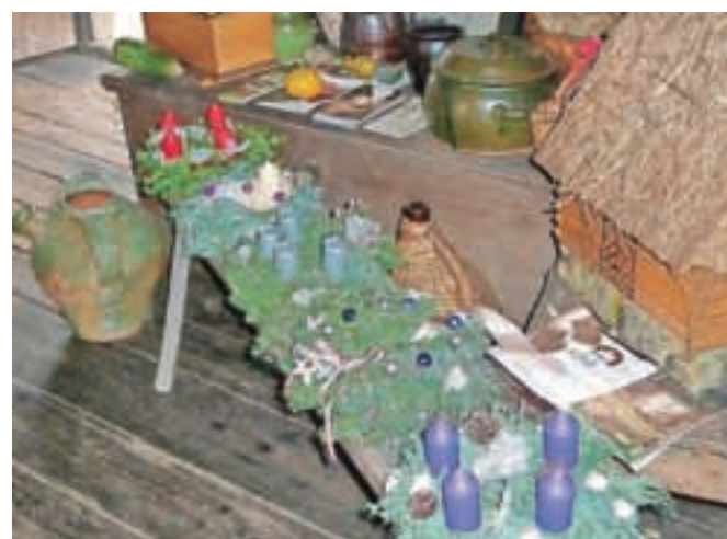
Na tradicionalni delavnici jih obiskovalci vsako leto izdelajo okoli dvajset.

ne materiale, obode iz slame, smrečje, storže ter številno drugo okrasje, ki ga lahko sami naberejo v